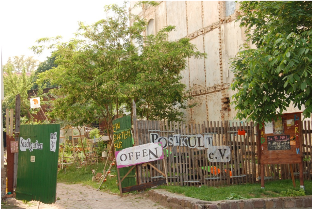
Figuur 3 – Stadslandbouw in Halle (2011)