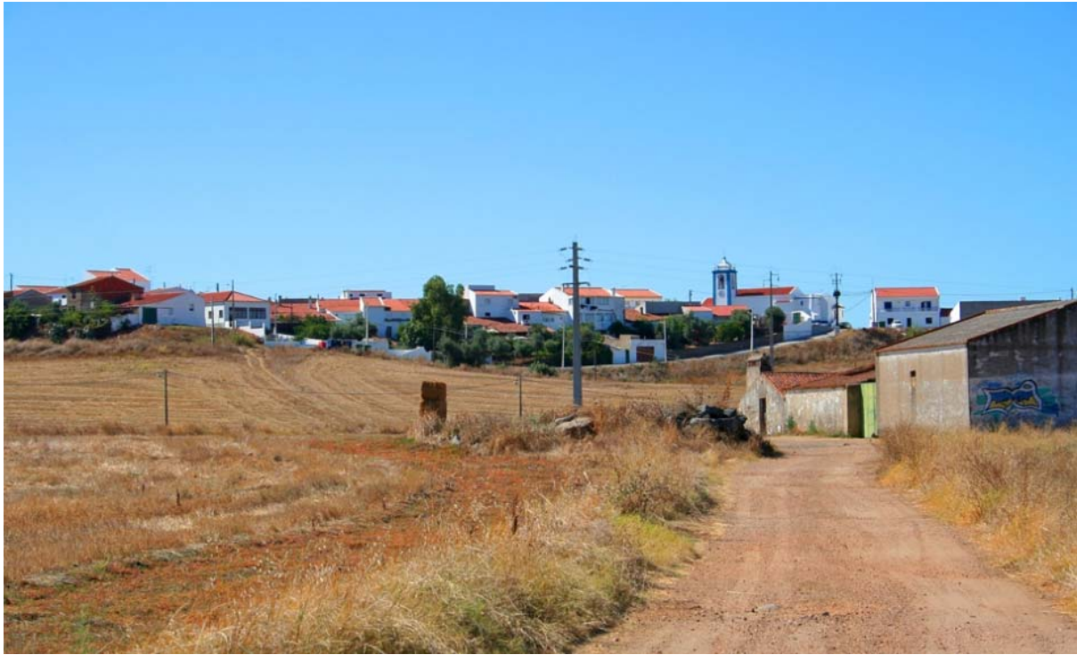
Figuur 1 – Het platteland van zuid Portugal